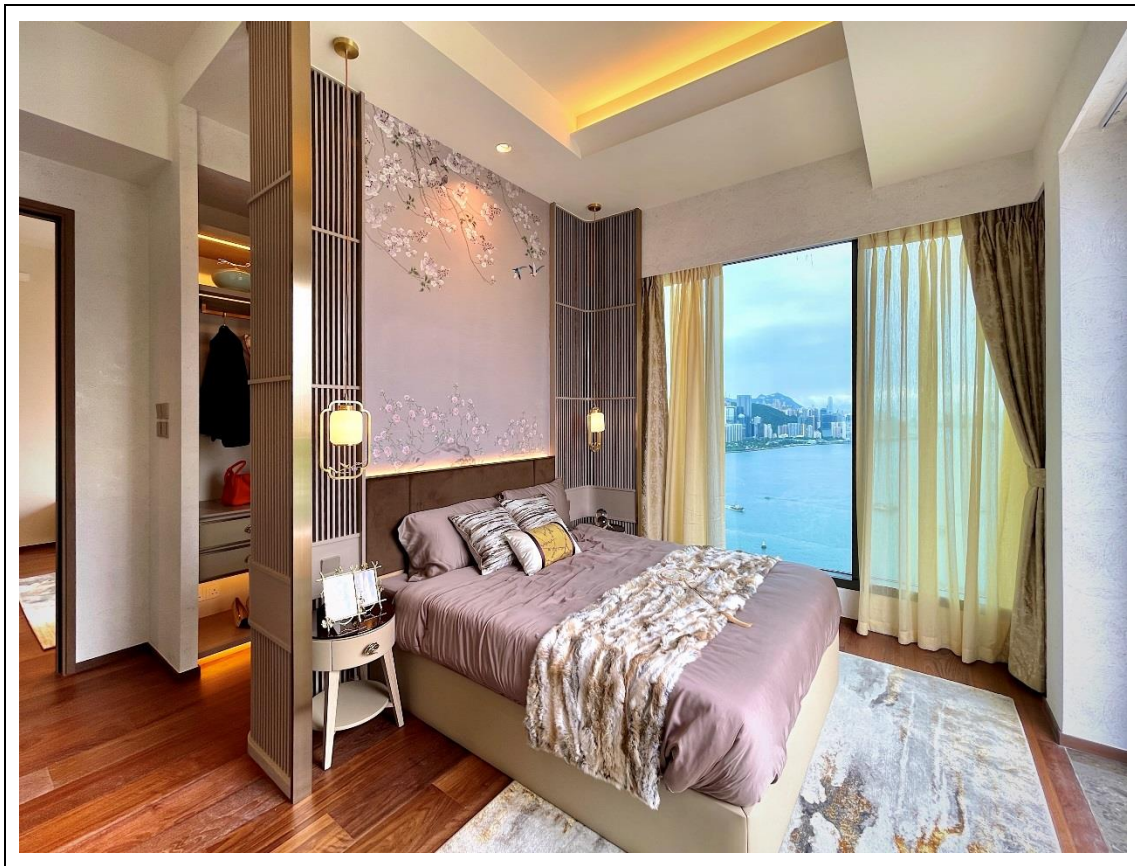
相片 2 5

延续东方色彩的设计效果，设计师将整体的东方格调带入了主人睡房。主人睡房中采用了中式木条子屏风作为分间墙，除了令衣帽间及睡眠区间隔得宜，又不失房间的通透感。